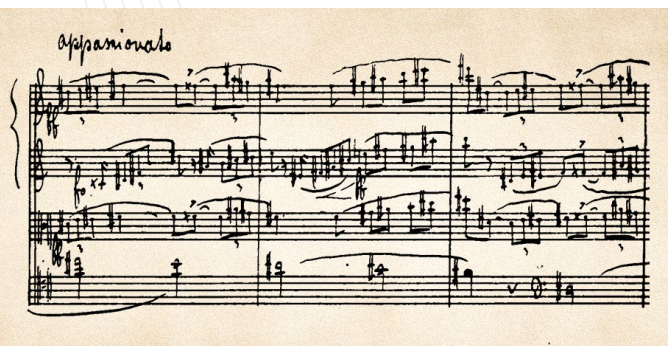
Richard Strauss: Particell-Handschrift (aus dem „Friedenswerke“-Teil)

Fasst man die bisherigen Teile der Tondichtung als „Exposition“ (sowohl des musikalischen Materials als auch der Charaktere) auf, erfolgt nun mit dem Abschnitt Des Helden Walstatt die „Durchführung“ des bereits Vorhandenen unter Hinzuziehung neuer Einfälle. Fanfaren leiten eine Kampfszenerie ein, die schließlich in einen vom Schlagwerk dominierten Marsch-Rhythmus im späteren Schostakowitsch-Stil mündet. Eine aus dem Widersacher-Motiv abgeleitete Trompeten-Geste prägt das Geschehen. Erneut zeigt sich der enge Zusammenhang von Form und Bedeutung: „Durchführung“ ist hier Aufeinanderprallen der Themen und gleichzeitig Kampf des Helden mit seinen Gegnern. Und wieder fungiert der poetische Gedanke dabei lediglich als Impuls für eine musikalisch autonome Entwicklung. Mag Strauss auch (wie es manche Interpreten unterstellen) bei der Walstatt an eine zünftige Oktoberfest-Schlägerei gedacht haben, an die Rauferei des Helden mit rivalisierenden Buam um ein Deandl (das thematisch übrigens auch ein paar Maßkrüge in die Arena schleudert) – die Musik bleibt, was sie