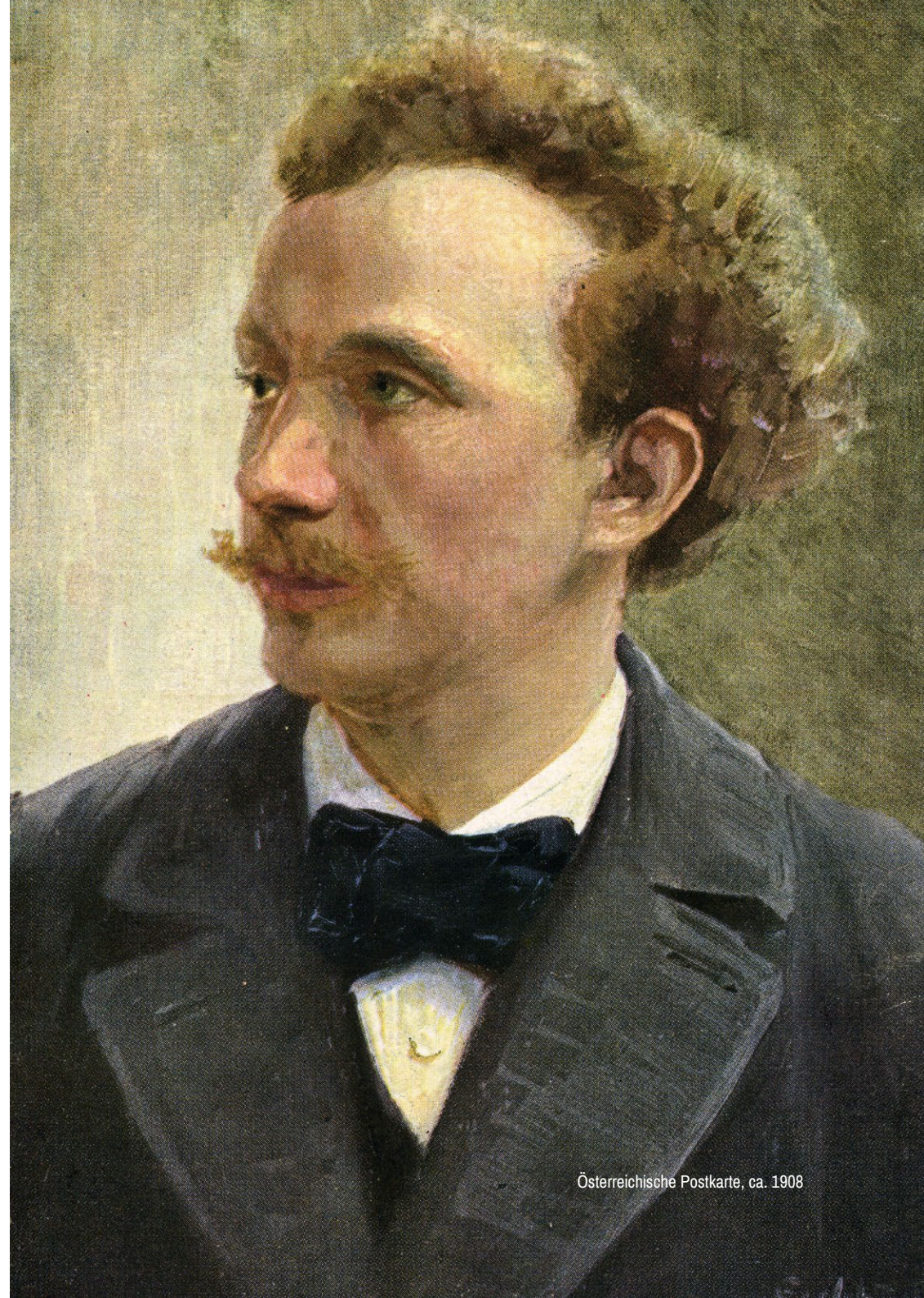
Österreichische Postkarte, ca. 1908

In den Tondichtungen vor dem Opus 40 – in Macbeth , Don Juan , Zarathustra , Don Quixote – hatte der Komponist zumeist auf tatsächlich poetische, nämlich literarische Anregungen zurückgegriffen. Aber schon im Till Eulenspiegel nahmen kundige Hörer das Geschehen in der Musik auch als Satire auf konkrete Münchener Verhältnisse wahr. Diesen persönlichen Zug verstärkte Strauss im Heldenleben enorm: Er selbst konnte dort als der „Held“ verstanden werden, und er leistete solchen Interpretationen auch durchaus Vorschub, etwa wenn er an Romain Rolland schrieb: „Ich sehe nicht ein, warum ich keine Symphonie auf mich selber machen sollte. Ich finde mich ebenso interessant wie Napoleon oder Alexander.“ Freilich lenkte